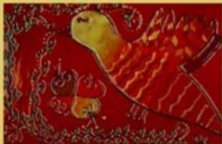
VIII. Országos Zománcművészeti Biennálé